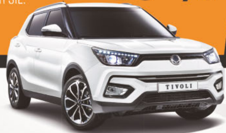
Abb. zeigt kostenpflichtige Sonderausstattungen.