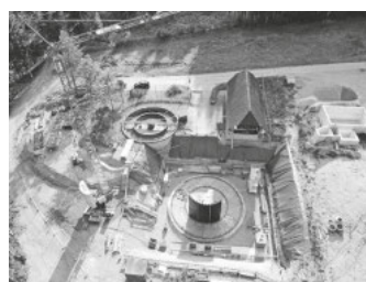
Luftbild Stand Juli 2020 / BA 1 und 2

Die Kläranlage Heppenschwand, welche das Abwasser der Ortsteile Heppenschwand, Attlisberg, Frohnschwand, Elmenegg und Oberweschnegg behandelt, ist 1984 in Betrieb gegangen. Aufgrund der stetig wachsenden Anforderungen an eine Abwasserreinigungsanlage und aufgrund der aktuellen Anschlusswerte war der grundlegende Umbau bzw. die Erweiterung der zwischenzeitlich in die Jahre gekommene Kläranlage zwingend erforderlich.