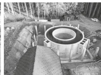
Bewehrung Bodenplatte Kombibecken Dichtigkeitsprüfung Kombibecken

Über den Jahreswechsel hat der Gemeinderat der Gemeinde Höchenschwand die maßgebenden weiteren Aufträge für den Ausbau der Kläranlage mit dem Gebäude über dem Kombibecken mit Fassade, der klärtechnischen Ausrüstung sowie der Elektro-, Mess-, Steuer- und Regeltechnik vergeben können. Derzeit laufen die detaillierten Abstimmungen zur Ausführung und Realisierung der zahlreichen Gewerke.