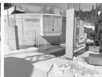
Situation Kombibecken 23.03.2021

In einem 1. Bauabschnitt wurde zur Sicherstellung des Klärbetriebes ein Pufferbecken mit einem Volumen von 100 m 3 im Zulauf zur Kläranlage neu installiert. Das Becken dient zur Pufferung und Vergleichmäßigung der Zuläufe zur Kläranlage bei Regenwetter bzw. bei Schneeschmelze. Gleichzeitig kann dieses Becken als Havariebecken, welches bereits seit Sommer 2019 in Betrieb ist, genutzt werden. Nachfolgend wurde die zwingend erforderliche Leistungserhöhung zur Stromversorgung am Standort der Kläranlage realisiert.