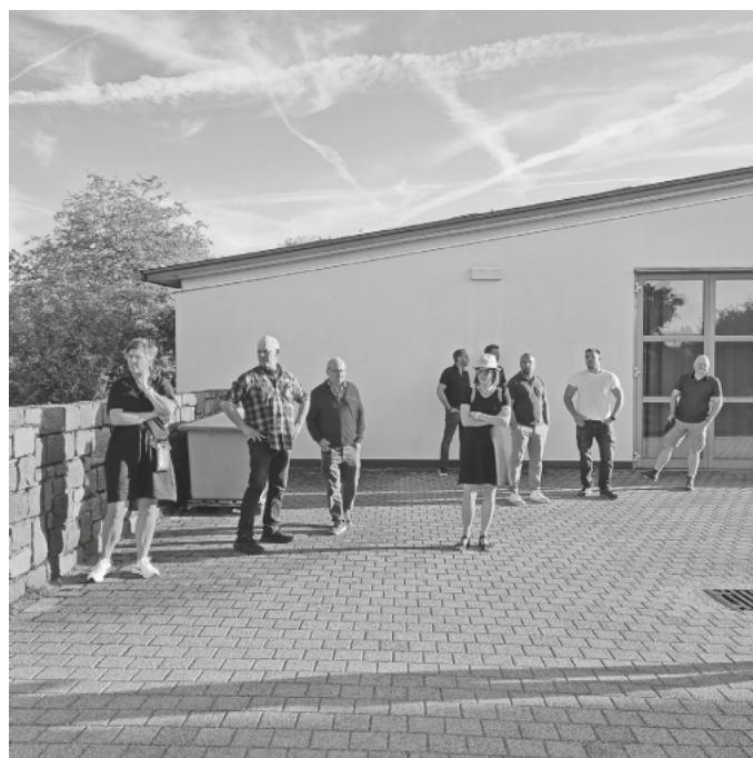
Besichtigung der Mauer am Friedhof mit dem Gemeinderat

Die Gemeinde beschafft beim Steinmetzbetrieb Rosa das Material für eine Steinabdeckung in rötlichem Granit für ca. 34 m zum Preis von 170,- Euro/lfm.