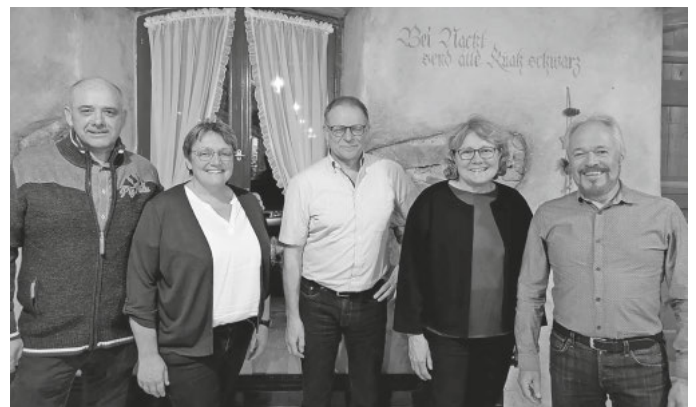
Vorstandschaft des Fördervereins der Trachtenkapelle Amrigschwand-Tiefenhäusern 2026

Für das kommende Jahr stehen bereits mehrere Höhepunkte auf dem Programm, darunter das Jahreskonzert am 28.03.26 sowie Auftritte beim Jubiläum der Guggenmusik Höllbachgeister in Rotzingen und das Bezirksmusikfest in Menzenschwand. Ganz besonders freut sich der gesamte Verein auf die bevorstehende 3-tägige Konzertreise ins Montafon zum Bezirksmusikfest der Bürgermusik Gaschurn-Partenen anlässlich deren 100-jährigem Bestehen.