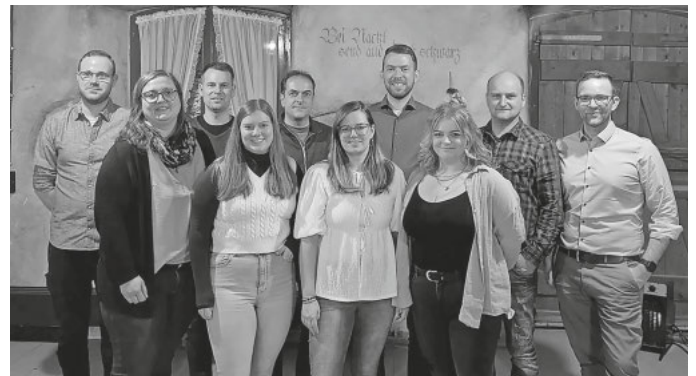
Vorstandschaft der Trachtenkapelle Amrigschwand-Tiefenhäusern 2026